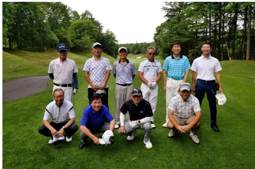
7. 11 親睦ゴルフ：軽井沢プレジデントGC